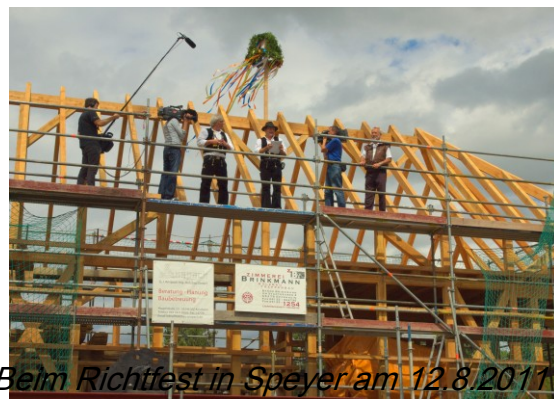
Beim Richtfest in Speyer am 12.8.2011